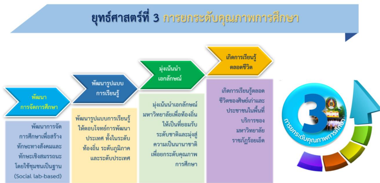
ภาพที่ 3 ยุทธศาสตร์ที่ 3 การยกระดับคุณภาพการศึกษาและความสอดคล้องของเป้าประสงค์

ปรับปรุงหลักสูตรเดิมให้ทันสมัยและพัฒนาหลักสูตรใหม่ในรูปแบบสหวิทยาการที่ตอบสนองต่อการพัฒนาท้องถิ่นและสอดคล้องกับแนวทางการพัฒนาประเทศ ส่งเสริมการเรียนรู้ของนักศึกษาให้มีทักษะชีวิต ทักษะวิชาชีพและทักษะวิชาการและพัฒนาระดับความสามารถทางภาษาของนักศึกษา โดยใช้กระบวนการ “วิศวกรสังคม” เป็นกลไกการพัฒนาทักษะเชิงสมรรถนะ(Soft Skills) คุณลักษณะ 4 ประการ ตามพระราชบัญญัติ เพื่อเป็นผู้นำการเปลี่ยนแปลงและพัฒนาชุมชนท้องถิ่น มุ่งเน้นความเป็นเลิศทางการศึกษา หลักสูตรสมรรถนะ การบูรณาการองค์ความรู้จากท้องถิ่นสู่มาตรฐานสากลและยกระดับการจัดการศึกษา งานวิจัยร่วมกับภาคีเครือข่าย ทั้งระดับชาติและนานาชาติ รวมทั้ง การนำเทคโนโลยีมาใช้ในการจัดการศึกษา