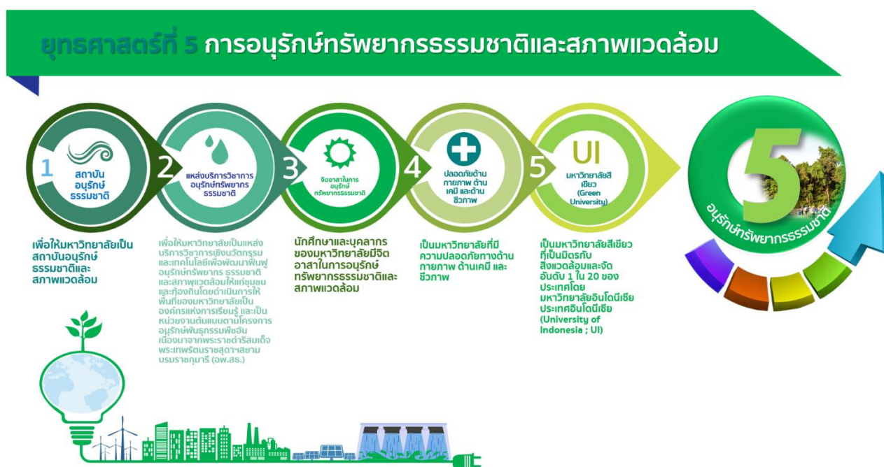
ภาพที่ 5 ยุทธศาสตร์ที่ 5 การอนุรักษ์ทรัพยากรธรรมชาติและสภาพแวดล้อม

มหาวิทยาลัยราชภัฏร้อยเอ็ด มุ่งเน้นการใช้ทรัพยากรธรรมชาติและสภาพแวดล้อมอย่างฉลาดโดยใช้ให้น้อย เพื่อให้เกิดประโยชน์สูงสุดโดยคำนึงถึงระยะเวลาในการใช้ให้ยาวนานและก่อให้เกิดผลเสียหายต่อสภาพแวดล้อมน้อยที่สุด รวมทั้งต้องมีการกระจายการใช้ทรัพยากรธรรมชาติอย่างทั่วถึง โดยทำการพัฒนาภูมิทัศน์และสภาพแวดล้อมให้ร่มรื่น น่าอยู่ น่าเรียนมีบรรยากาศทางวิชาการ สร้างความรัก ความสามัคคี สร้างสุขภาวะที่ดี เพื่อให้นักศึกษาและบุคลากรทุกคนมีความสุข อบอุ่น และปลอดภัยและในปี 2567 ให้ได้รับรางวัลมหาวิทยาลัยสีเขียว (Green University) บริการวิชาการเพื่อพัฒนาฟื้นฟูและอนุรักษ์ทรัพยากรธรรมชาติและสภาพแวดล้อมให้แก่ชุมชน และท้องถิ่นโดยดำเนินการให้พื้นที่ของมหาวิทยาลัยเป็นองค์กรแห่งการเรียนรู้และเป็นหน่วยงานต้นแบบตามโครงการอนุรักษ์พันธุกรรมพืชอันเนื่องมาจากพระราชดำริสมเด็จพระเทพรัตนราชสุดาฯ สยามบรมราชกุมารี (อพ.สธ.)