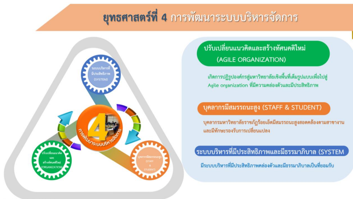
ภาพที่ 4 ยุทธศาสตร์ที่ 4 การพัฒนาระบบบริหารจัดการและความสอดคล้องเป้าประสงค์

มหาวิทยาลัยราชภัฏร้อยเอ็ด มุ่งเน้นและให้ความสำคัญหลักการบริหารจัดการองค์กรที่ดีใช้หลักธรรมาภิบาลควบคู่กับ เน็กซ์ โมเดล (NEXTS Model) ปรับปรุงและพัฒนาองค์กรสู่ดิจิทัลและมหาวิทยาลัยสีเขียว (Digital organization & Green university) และพัฒนาบุคลากรให้เป็นผู้ประกอบการเปลี่ยนแปลงมีการปรับเปลี่ยนแนวคิดและสร้างทัศนคติใหม่ (Agile learner) พร้อมทำงานเชิงรุก รวมทั้งจัดทำระบบสวัสดิการเพื่อสนับสนุนกิจการของมหาวิทยาลัย เน้นการสร้างเครือข่ายเพื่อการพัฒนาทางด้านต่าง ๆ เป็นสถาบันการศึกษาเพื่อการพัฒนาท้องถิ่น พัฒนาศูนย์ข้อมูลและระบบสารสนเทศที่มีประสิทธิภาพและทันสมัย ส่งเสริม สนับสนุนนักศึกษา และบุคลากรให้เข้าถึงระบบข้อมูลและสารสนเทศอย่างครอบคลุมทุกพื้นที่และอย่างมีประสิทธิภาพ