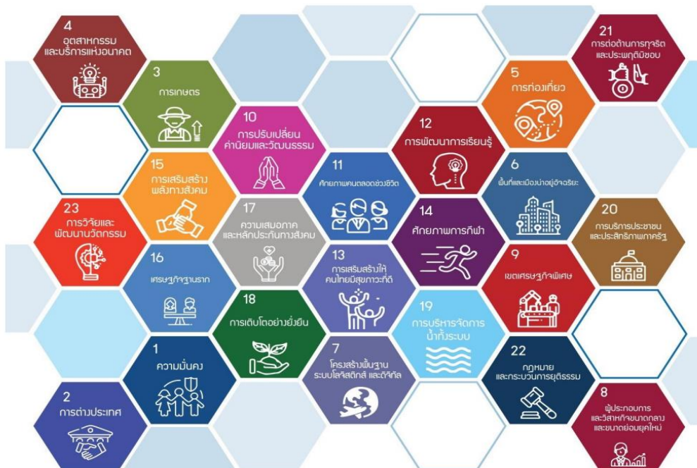
ภาพที่ 8 แผนแม่บท 23 ประเด็น

แผนแม่บทภายใต้ยุทธศาสตร์ชาติเป็นส่วนสำคัญในการถ่ายทอดเป้าหมายและประเด็นยุทธศาสตร์ ของยุทธศาสตร์ชาติลงสู่แผนระดับต่าง ๆ ต่อไป ซึ่งได้คำนึงถึงประเด็นร่วมหรือประเด็นตัดข้ามยุทธศาสตร์ และการประสานเชื่อมโยงเป้าหมายของแต่ละแผนแม่บทภายใต้ยุทธศาสตร์ชาติให้มีความสอดคล้องไปในทิศทางเดียวกัน แนวทางการพัฒนาและแผนงาน/โครงการที่สำคัญของแผนแม่บทภายใต้ยุทธศาสตร์ชาติ เพื่อเป็นกรอบในการดำเนินการของหน่วยงานที่เกี่ยวข้องให้บรรลุเป้าหมายการพัฒนาประเทศที่กำหนดไว้ แผนแม่บทภายใต้ยุทธศาสตร์ชาติ มีจำนวนรวม 23 ฉบับ