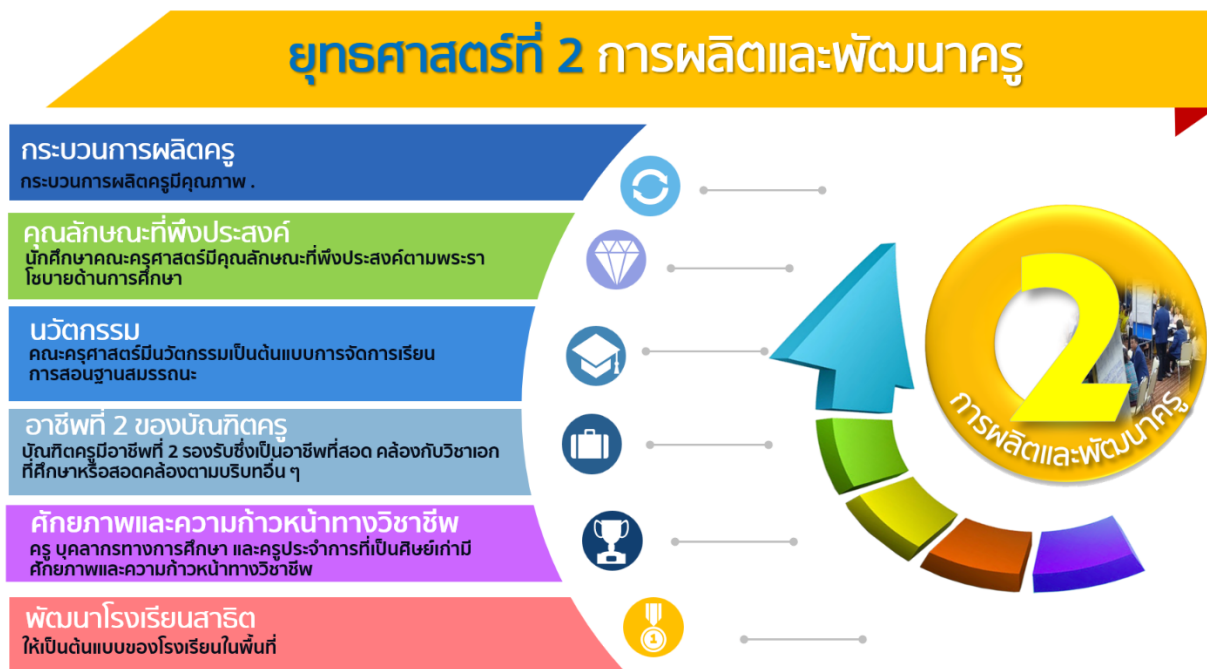
ภาพที่ 2 ยุทธศาสตร์ที่ 2 การผลิตและพัฒนาครู และความสอดคล้องของเป้าประสงค์

มหาวิทยาลัยราชภัฏร้อยเอ็ด มุ่งบูรณาการการผลิตบัณฑิตครูศาสตร์แบบสหวิทยาการและเสริมสร้างสมรรถนะ และทักษะ เพื่อการพัฒนากระบวนการผลิตครูให้มีความสมดุลทั้งคุณภาพและคุณธรรม เพื่อเป็นต้นแบบครูเพื่อศิษย์ ตลอดจนพัฒนานวัตกรรมการศึกษาตอบโจทย์การศึกษาของโลกอนาคตร่วมกับภาคีเครือข่ายที่เกี่ยวข้อง เพื่อนำไปสู่ การเป็นนักพัฒนาและนวัตกรรมที่มีทัศนคติที่ดีมีอัตลักษณ์ และความโดดเด่นหลากหลาย สอดคล้องกับความต้องการ บุคลากรครูของท้องถิ่นและประเทศ และมีมาตรฐานระดับสากล พร้อมยกระดับความก้าวหน้าทางวิชาชีพครูของบัณฑิต ครูราชภัฏอย่างต่อเนื่อง เพื่อความมั่นคงทางเศรษฐกิจและสังคม ตามหลักปรัชญาเศรษฐกิจพอเพียง