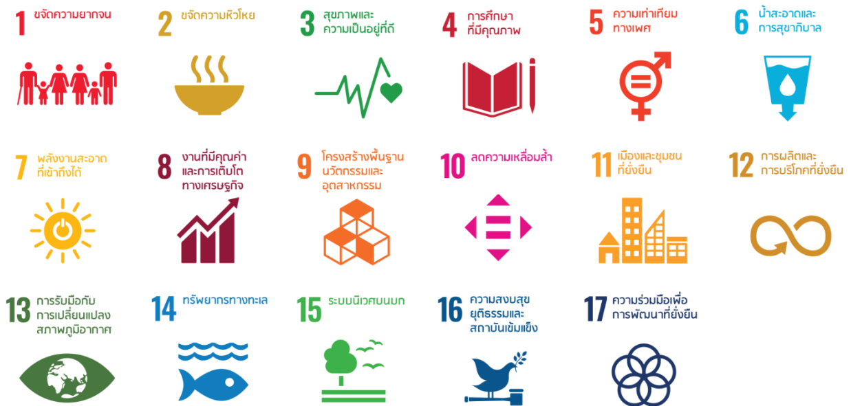
ภาพที่ 10 เป้าหมายการพัฒนาที่ยั่งยืน (Sustainable Development Goals – SDGs)