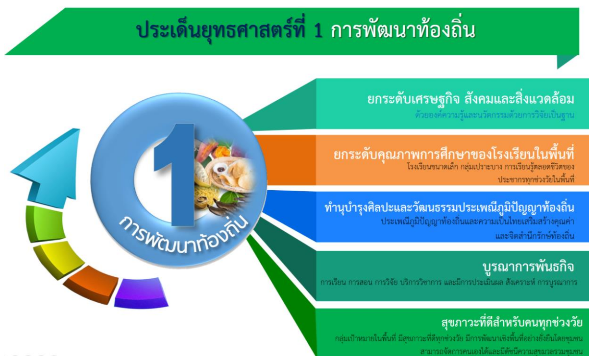
ภาพที่ 1 ยุทธศาสตร์ที่ 1 การพัฒนาท้องถิ่น และความสอดคล้องของเป้าประสงค์

มหาวิทยาลัยราชภัฏร้อยเอ็ด มุ่งการบูรณาการการบริการวิชาการกับการเรียนการสอน การวิจัยและการผลิตบัณฑิตที่เชื่อมโยงภูมิปัญญาในระดับท้องถิ่นระดับชาติและระดับสากล นำองค์ความรู้ที่มีความหลากหลายทางวิชาการไปพัฒนาชุมชนเสริมสร้างความเข้มแข็งของผู้นำชุมชนและท้องถิ่น โดยมีการประสานความร่วมมือและช่วยเหลือเกื้อกูลกันระหว่างมหาวิทยาลัย ชุมชน พัฒนาความรู้ด้านการประกอบอาชีพ เพื่อสร้างรายได้ให้กับชุมชนผ่านการพัฒนาศักยภาพด้านสินค้าและบริการ พัฒนาชุมชนให้เป็นแหล่งท่องเที่ยวเชิงวัฒนธรรม