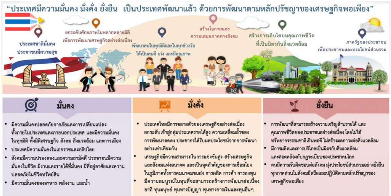
ภาพที่ 7 กรอบแผนยุทธศาสตร์ชาติ