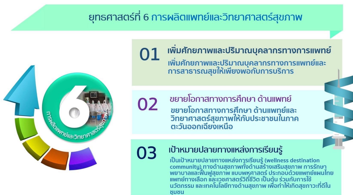
ภาพที่ 6 ยุทธศาสตร์ที่ 6 การผลิตแพทย์และวิทยาศาสตร์สุขภาพ

มหาวิทยาลัยราชภัฏร้อยเอ็ด ตระหนักและเล็งเห็นถึงคุณภาพชีวิตและสุขภาพอนามัยของประชากรในปัจจุบัน จึงจำเป็นต้องผลิตบุคลากรทางการสาธารณสุขเพิ่มมากขึ้น เพื่อให้สามารถกระจายไปสู่ระดับท้องถิ่น ชุมชนได้สัดส่วนที่เหมาะสมและสอดคล้องกับแผนพัฒนาเศรษฐกิจและสังคมแห่งชาติ ฉบับที่ 13 พ.ศ. 2567 - 2570 ภายใต้วิสัยทัศน์ “มุ่งพัฒนาผู้เรียนให้มีความรู้คู่คุณธรรม มีคุณภาพชีวิตที่ดี มีความสุขในสังคม”