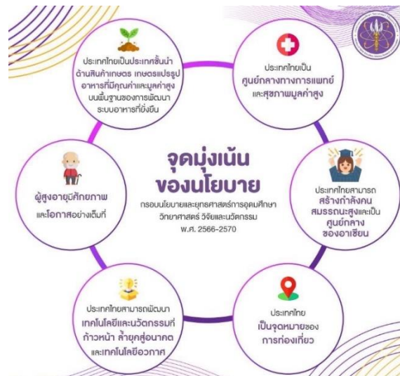
ภาพที่ 9 จุดมุ่งเน้นของนโยบายกรอบนโยบายและยุทธศาสตร์การอุดมศึกษา วิทยาศาสตร์ วิจัยและนวัตกรรม